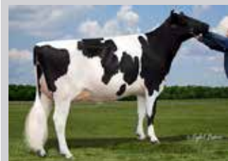
CEDARWAL SUPERSIRE LADYBUG